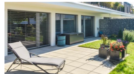
4½-Zimmer-Wohnung in Oberrohrdorf