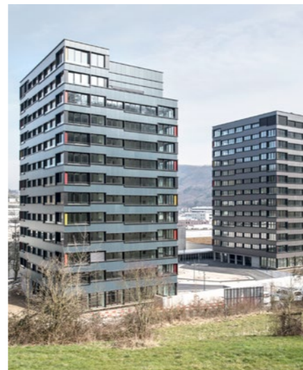
Überbauung «Belétage» in Baden