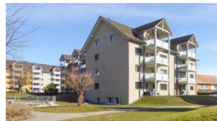
Wohnüberbauung in Heerbrugg