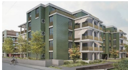
Wohnbauprojekt «Letzigraben» in Zürich