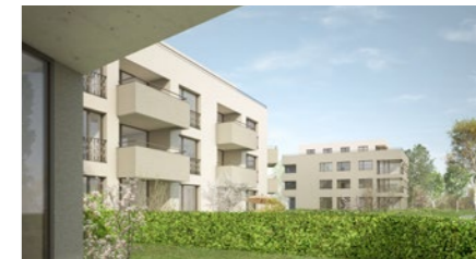
Wohnüberbauung «Muniwis» in Weiningen