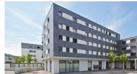
Wohnüberbauung «Sonnenpark» in Seon