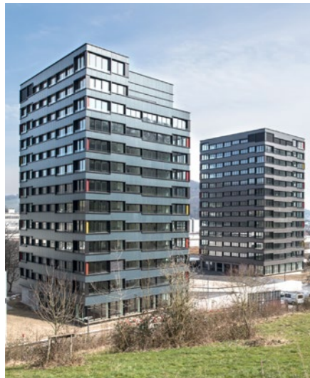
Wohnüberbauung «Belétage Martinsberg» in Baden