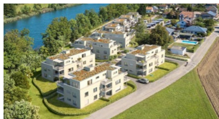
Wohnbauprojekt «Five Elements an der Aare» in Wangen an der Aare