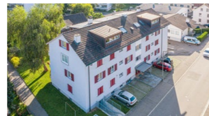
Mehrfamilienhaus in Winterthur