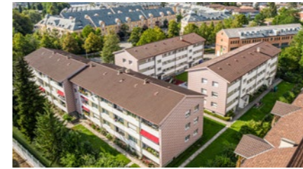
Wohnüberbauung in Burgdorf