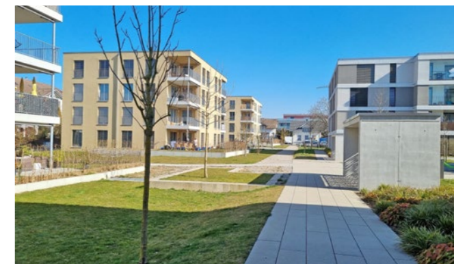
Wohnbauprojekt in Oftringen