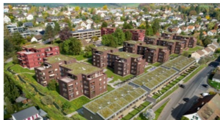
Wohnüberbauung «Baumgarten» in Küttigen