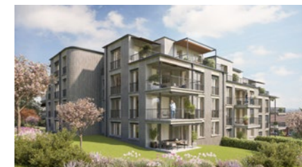
Wohnüberbauung «Holderbachweg» in Zürich