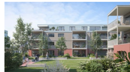
Wohnüberbauung in Herzogenbuchsee