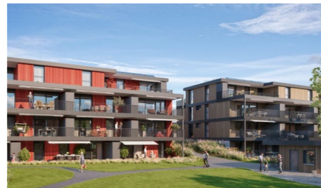
Wohnbauprojekt in Bachenbülach

Auftraggeberin Vertina Anlagestiftung, Baden Funktion Markstein Geschäftsführung, Akquisition, Entwicklung, Finanzen Anlagevolumen (31.3.2023) CHF 62 Mio. Ziel-Performance 3% bis 4% p.a. Anzahl Wohnungen nach Fertigstellung 147 Wohnungen Gesamtvolumen nach Fertigstellung CHF 121 Mio.