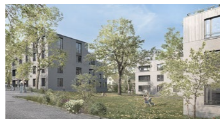
Wohnbauprojekt «3 Freunde am Bahnhof» in Aarwangen