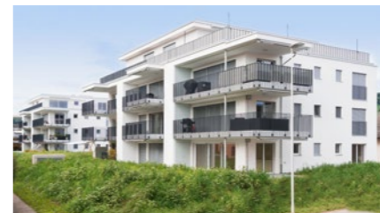
Wohnüberbauung in Kleindöttingen