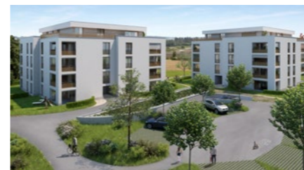
Wohnüberbauung in Birr