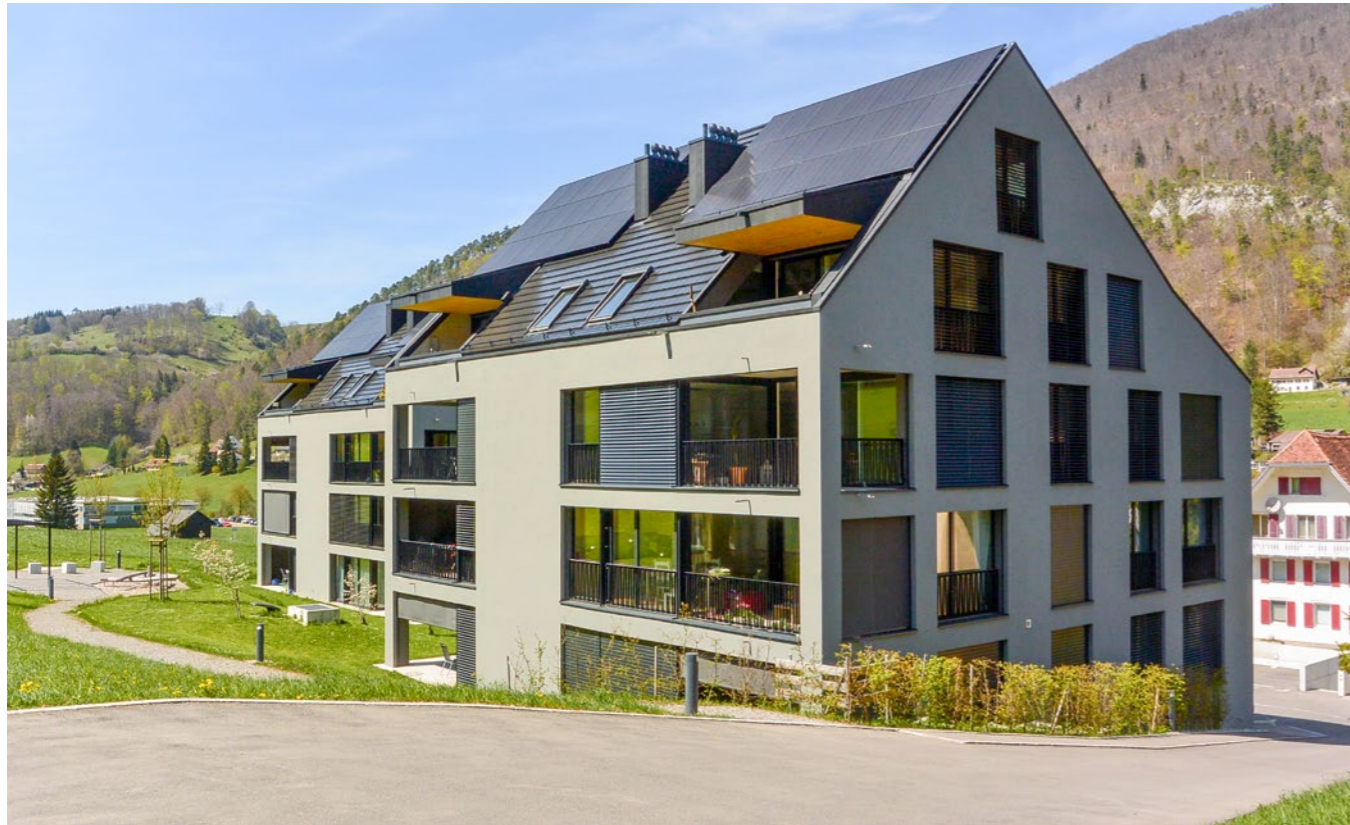
Wohnüberbauung «Mühlfeldstrasse» in Holderbank