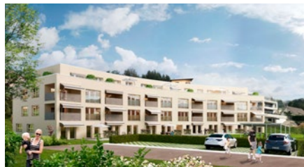
Wohnbauprojekt «Müllisberg» in Kaltbrunn