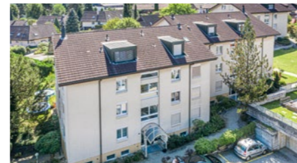
Wohnüberbauung in Münchenbuchsee