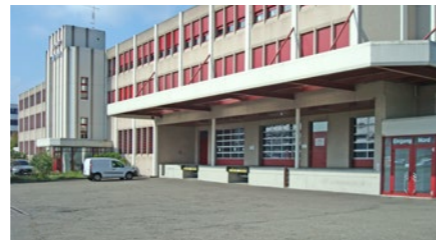
Gewerbegebäude in Weinfelden