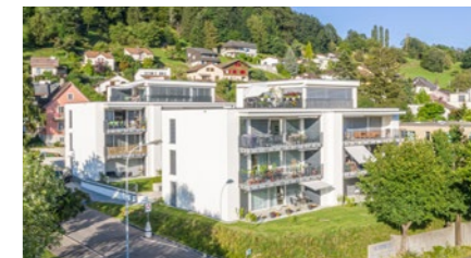
Wohnüberbauung in Wettingen