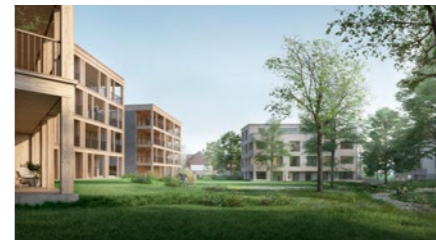
Überbauung «Zentrum» in Stetten