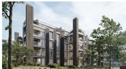
Wohnbauprojekt «Katzenbach» in Zürich