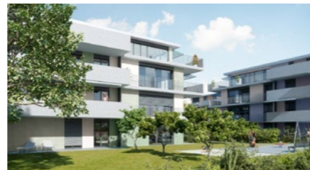
Wohnbauprojekt «Im Schäfer» in Dulliken