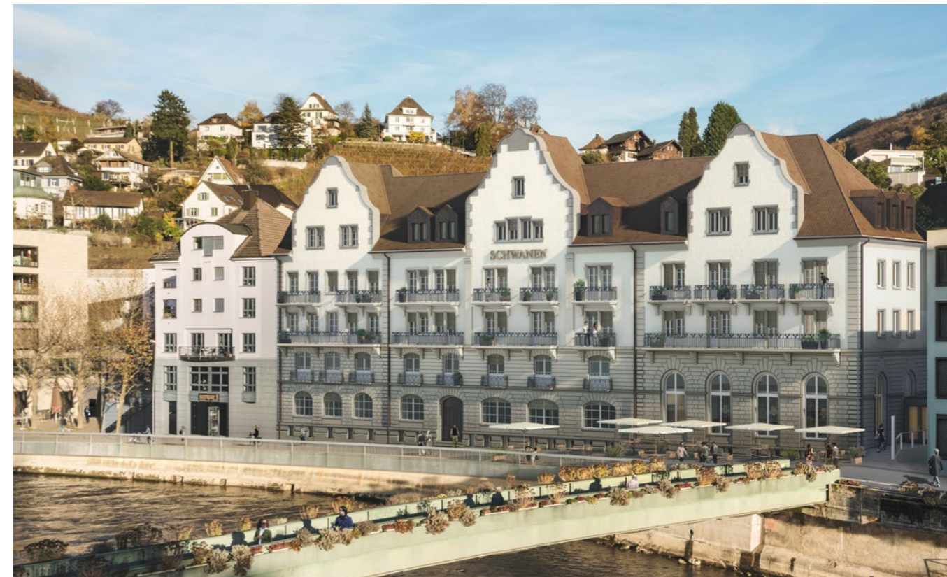
Verkauf und Erstvermietung: Überbauung «Bad Schwanen» in Ennetbaden.

Markstein verkauft neue und bestehende Eigentumswohnungen, Einfamilien-, Reihen- und Terrassenhäuser, Stockwerkeigentumsprojekte und Bauland in den Kantonen Aargau und Zürich. Eine weitere Kernkompetenz von uns ist die Erstvermietung von Neubauprojekten. Beginnend mit der Produkt- und Preisgestaltung stehen wir Ihnen während des gesamten Vermarktungsprozesses zur Seite, initiieren die geeigneten Marketingmassnahmen und führen die Verhandlungen bis zum erfolgreichen Vertragsabschluss.