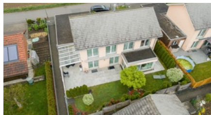
6½-Zimmer-Einfamilienhaus in Opfikon