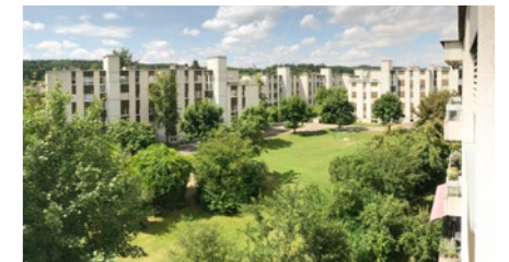
Wohnüberbauung in Suhr