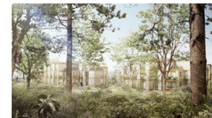
Wohnüberbauung in Zürich Leimbach