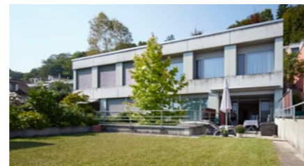
5½-Zimmer-Maisonette-Terrassenhaus in Brugg