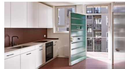
Mehrfamilienhaus in Zürich