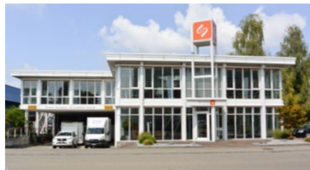
Gewerbegebäude in Bachenbülach