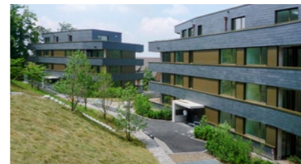
Wohnüberbauung «Classic Riehen» in Riehen