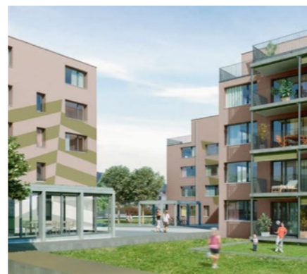
Wohnüberbauung «Dockland» in Villmergen