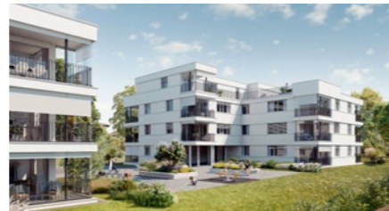
Wohnbauprojekt «Am Heuweg» in Aarau Rohr