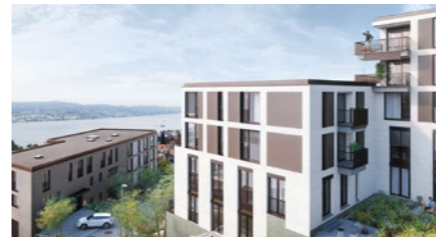
Wohnüberbauung «Seesehn» in Horgen