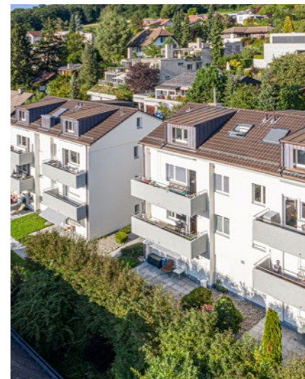
Wohnüberbauung in Hedingen