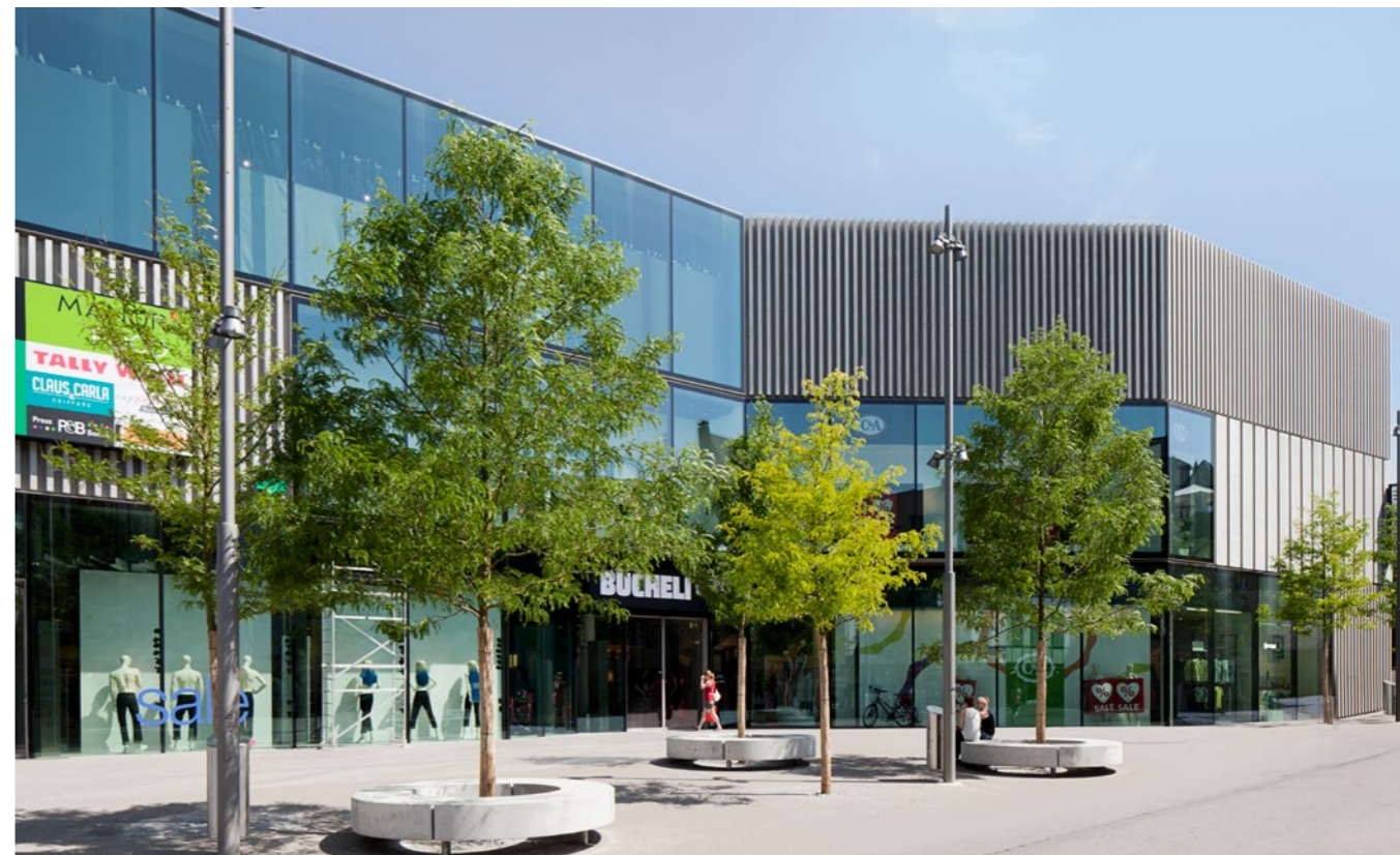
Verkauf: Einkaufszentrum «Bücheli» in Liestal.

Im heutigen Marktumfeld, wo Anlageobjekte sehr gesucht sind, zählen Fachwissen, langjährige Erfahrung und fundierte Branchenkenntnisse, aber auch schnelles Agieren und «guter Instinkt». Der enge Kontakt zu privaten Investoren, Pensionskassen, Versicherungen und Banken verschafft Markstein den entscheidenden Vorsprung, wenn es darum geht, ein Objekt gewinnbringend zu verkaufen.