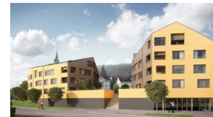
Wohnüberbauung «Zentrum Mitte» in Villmergen