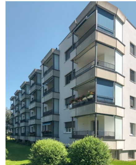
Mehrfamilienhaus in Winterthur