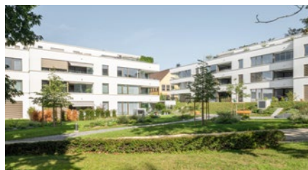
Überbauung «Ich bin im Garten» in Baden-Rüthof