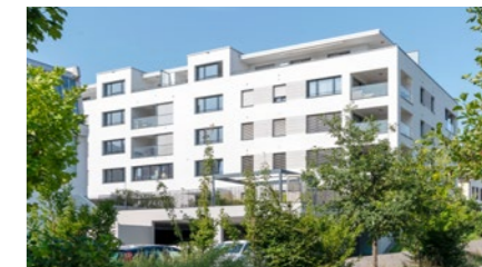
Wohn-/Geschäftshaus in Rorschach