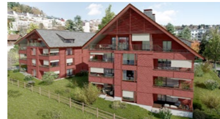
Überbauung «HW 14» in Zürich