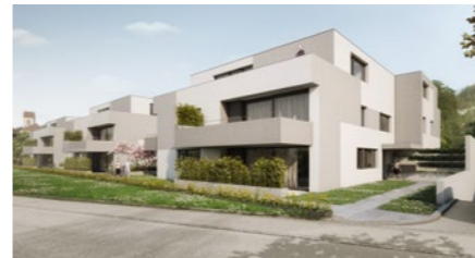
Wohnbauprojekt «Hofackerstrasse» in Oberbuchsitzen