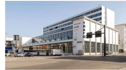
5½-Zimmer-Attika-Maisonette-Wohnung in Baden