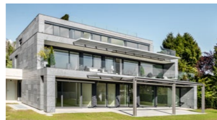
Überbauung «Dorfhalden 1» in Stäfa