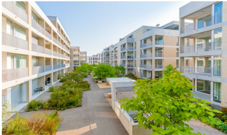
Wohnüberbauung «Bahnhofareal Nord» in Suhr