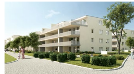
Wohnbauprojekt «Chilenwisenstrasse» in Dällikon