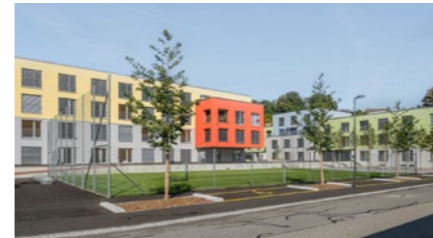
Wohnüberbauung «Typonareal» in Burgdorf