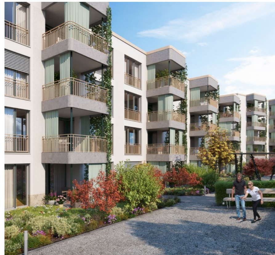
Wohnüberbauung «Sonnenweg» in Windisch