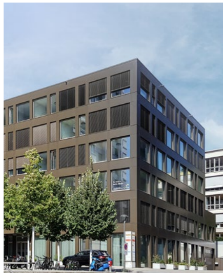
Geschäftshaus in Baden