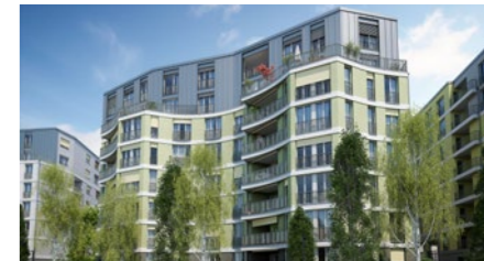
Überbauung «Glasi Haus Oscar» in Bülach