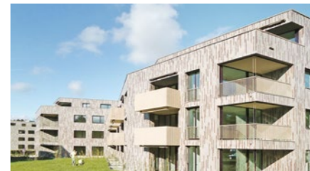
Wohnüberbauung «Munwis» in Weiningen