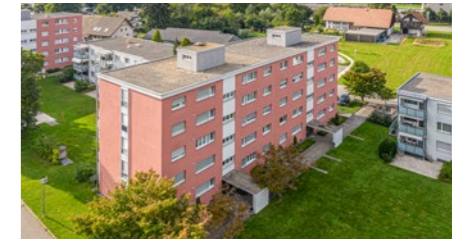
Wohnüberbauung in Rothrist