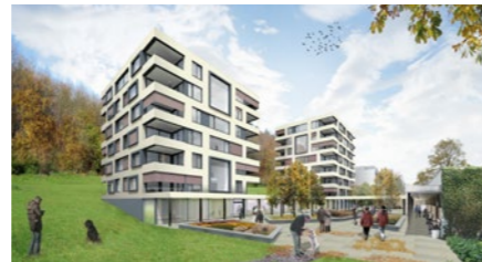
Alterszentrum «Das Kehl» in Baden