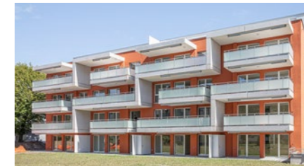
Mehrfamilienhaus in Nussbaumen AG