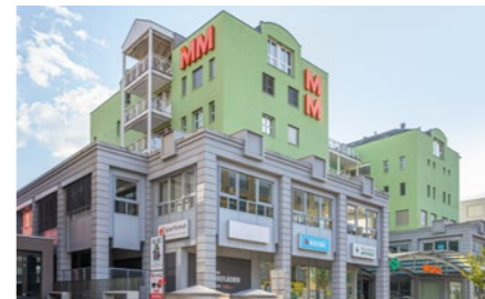
Wohn- und Geschäftshaus in Landquart