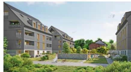
Überbauung «Im Rank» in Kloten