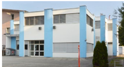
Gewerbegebäude in Möhlin