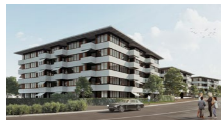
Wohnbauprojekt «Kappelerhof» in Baden