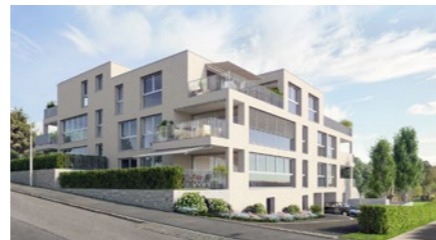
Überbauung «Solitär» in Zürich Affoltern