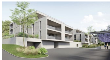
Überbauung «Weitsicht» in Küttigen