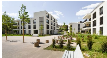
Überbauung «Lindenhof» in Boniswil