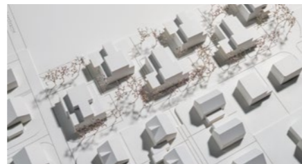
Wohnüberbauung «Langacker» in Rupperswil