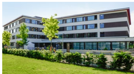
Alters- und Pflegeheim «Länzerthus» in Rapperswil