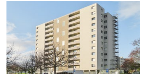
Mehrfamilienhaus in Port