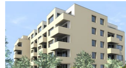
Wohnbauprojekt «Terra Chiara» in Biel