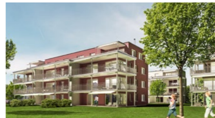
Wohnbauprojekt «Im Gröttli» in Wilen bei Wil