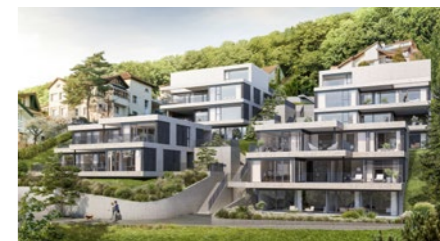
Überbauung «Estrade» in Wettingen