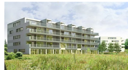
Überbauung «Ahornweg» in Adliswil