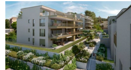
Überbauung «Joyce» in Urdorf