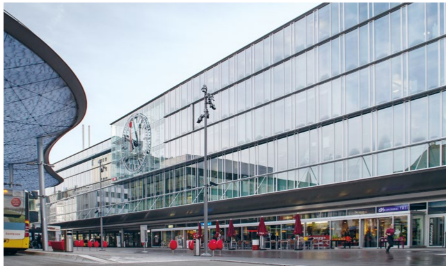
Ambulantes Zentrum am Bahnhof in Aarau