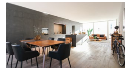
Wohnüberbauung in Zunzgen