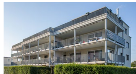
Mehrfamilienhaus in Wilen bei Wil