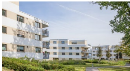
Wohnüberbauung «Eichbergpark» in Hombrechtikon