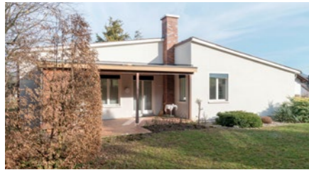
5½-Zimmer-Einfamilienhaus in Bad Zurzach