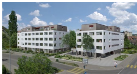
Wohnbauprojekt «Bermuda» in Niederglatt