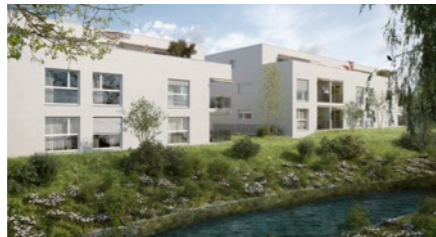
Überbauung «Mühlematte» in Zunzgen