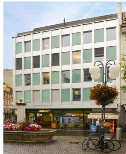
Geschäftshaus in Biel