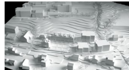
Wohnüberbauung in Hitzkirch