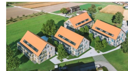
Wohnüberbauung in Flaach