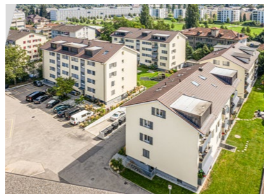
5 Wohn- und Geschäftshäuser mit 73 Wohnungen und 8 Gewerbeobjekten in Köniz