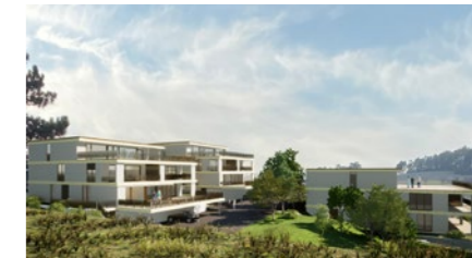
Wohnüberbauung in Herznach