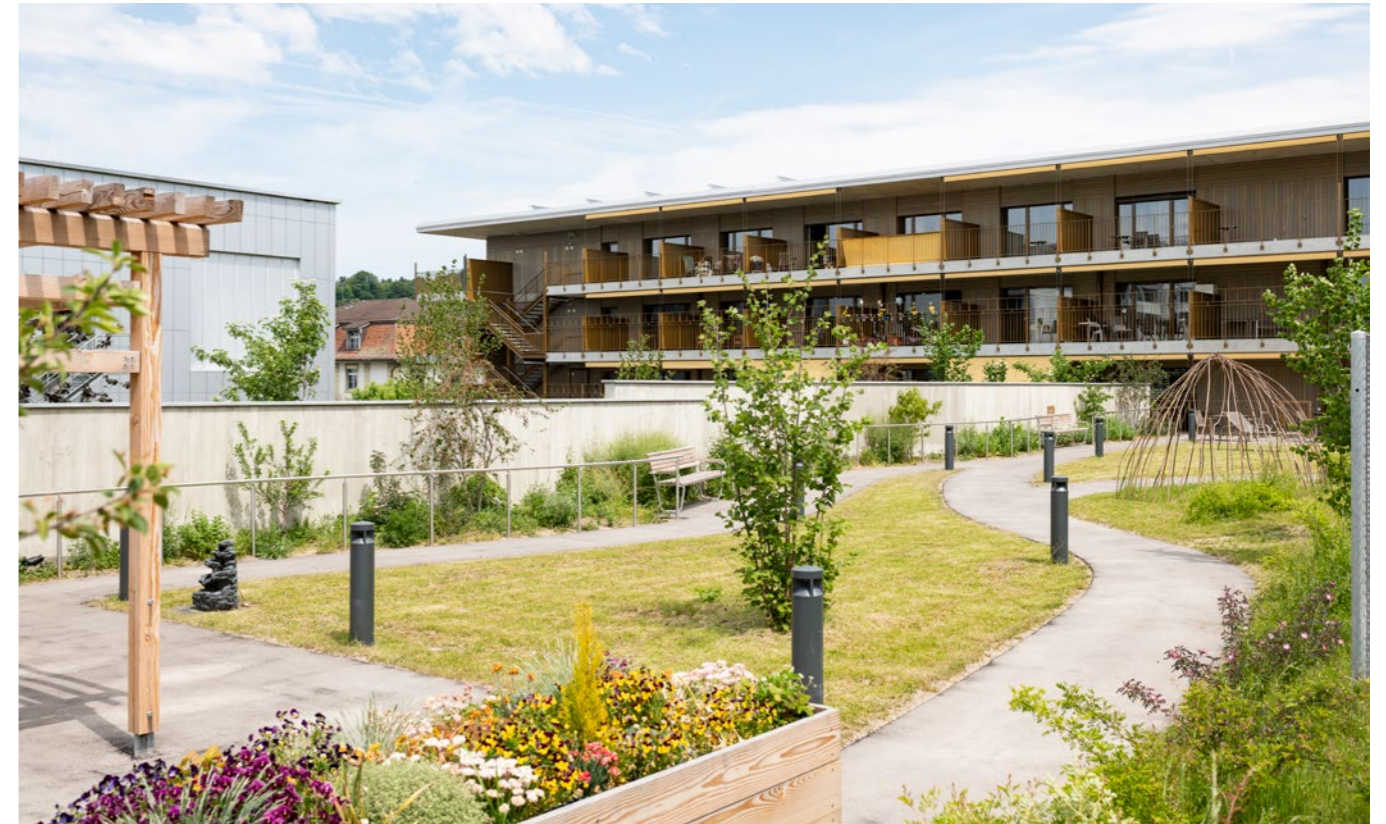
Erweiterungsbau: Demenzabteilung Senevita AG in Burgdorf

Markstein bietet die gesamte Dienstleistungspalette an, von der Erarbeitung einer Immobilienstrategie über die Bewertung bis hin zur Bauherrenvertretung. Unser interdisziplinäres Team, bestehend aus Ingenieuren, Bau- und Immobilienfachleuten, unterstützt Sie im gesamten Bauprozess oder phasenweise, wann immer unsere Kompetenz gefragt ist.