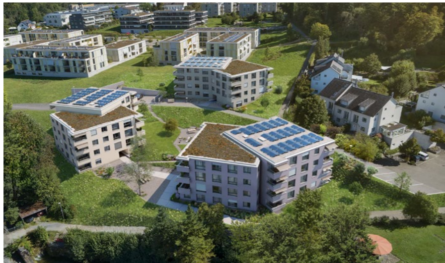
Wohnüberbauung «Am Oeliweiher» in Gossau ZH