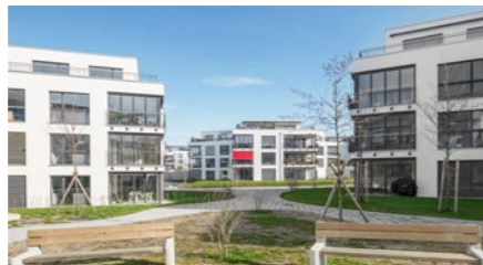
Überbauung «Ypsilon» in Niederrohrdorf