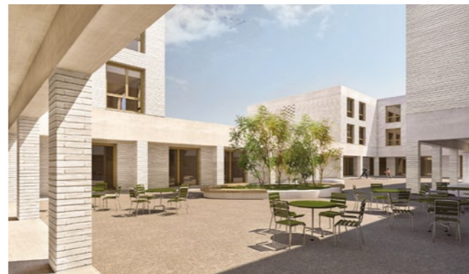
Mehrzweckgebäude «Wynere» in Wettingen