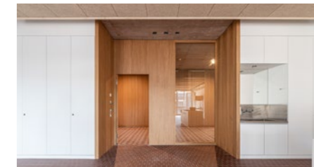
Sekundarstufenzentrum «Burghalde» in Baden