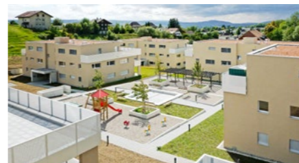
Wohnüberbauung «Lindenpark» in Selzach