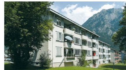
Mehrfamilienhaus in Glarus