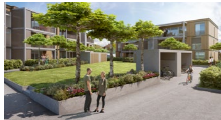
Wohnbauprojekt «Blumenhof» in Oensingen