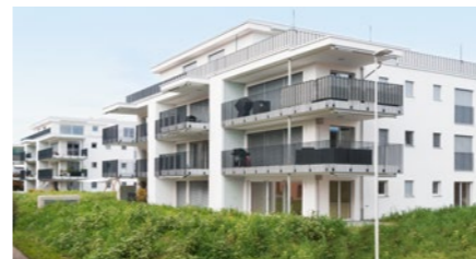
Überbauung «Identico» in Kleindöttingen