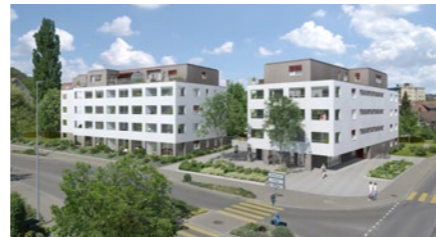
Überbauung «Bermuda» in Niederglatt