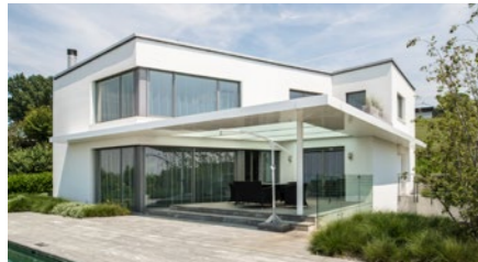
5½-Zimmer-Villa in Bellikon