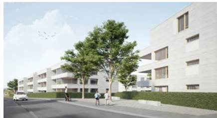
Überbauung «Eichmatt» in Fislisbach