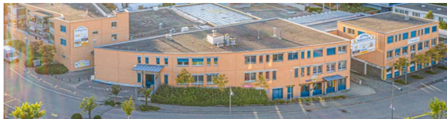
Gewerbegebäude in Rudolfstetten