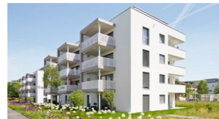
Überbauung «Geelig» in Gebenstorf