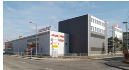
Fachmarkt «Markthalle» in Winterthur