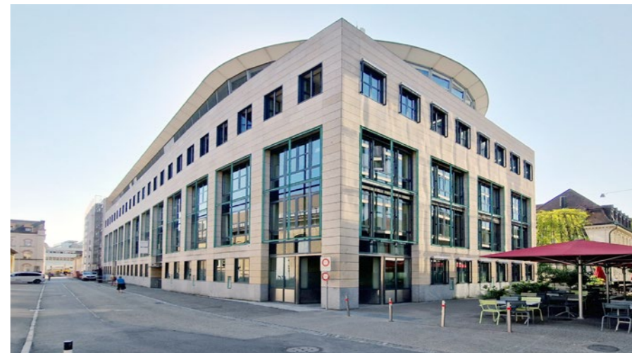
Wohn- und Geschäftshaus in Aarau