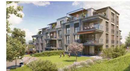
Wohnüberbauung in Zürich Affoltern