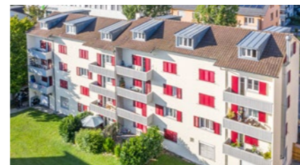
Wohn-/Geschäftshaus in Wettingen