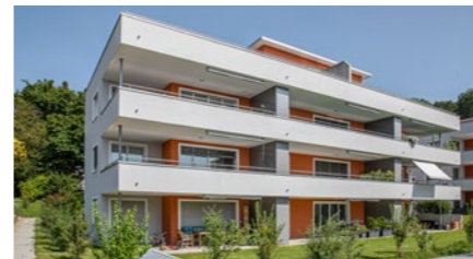
Mehrfamilienhaus in Tagelswangen