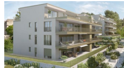
Wohnüberbauung in Urdorf