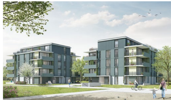
Wohnüberbauung «Stazzo» in Bad Ragaz