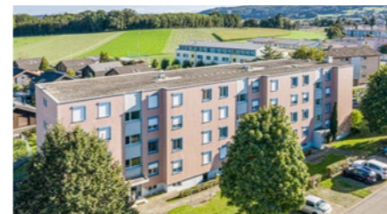
Wohnüberbauung in Dottikon