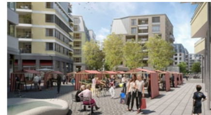
Überbauung «Glasi» in Bülach