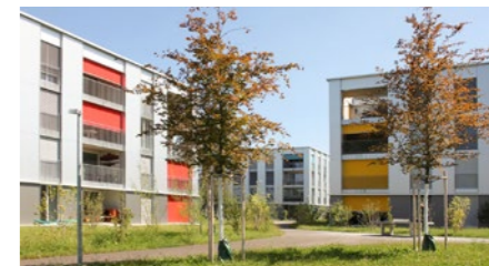
Überbauung «Punkt 7» in Mellingen