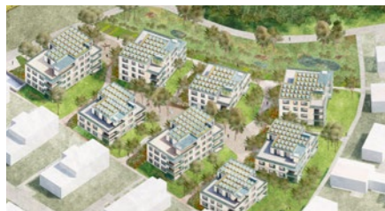
Wohnüberbauung «Feisler» in Riniken