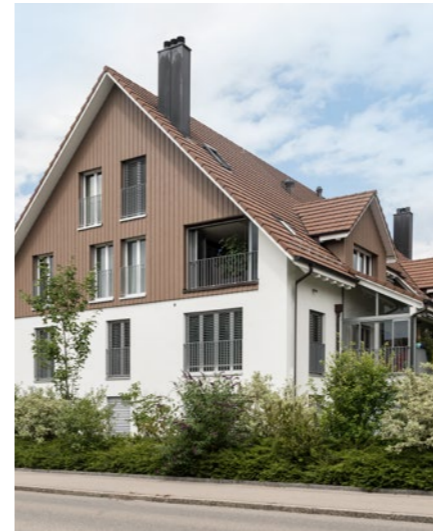
4½-Zimmer-Wohnung in Dübendorf