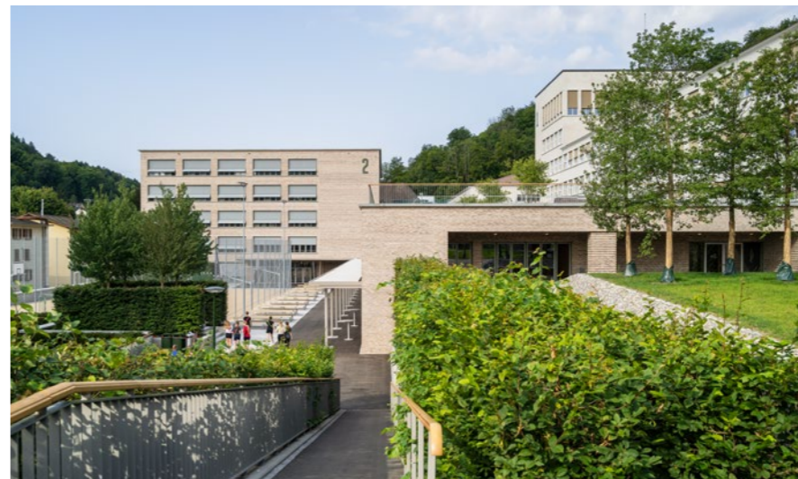
Sekundarstufenzentrum «Burghalde» in Baden