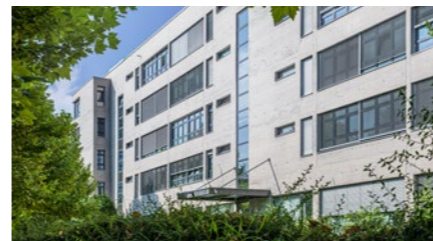
Wohnüberbauung in Bern