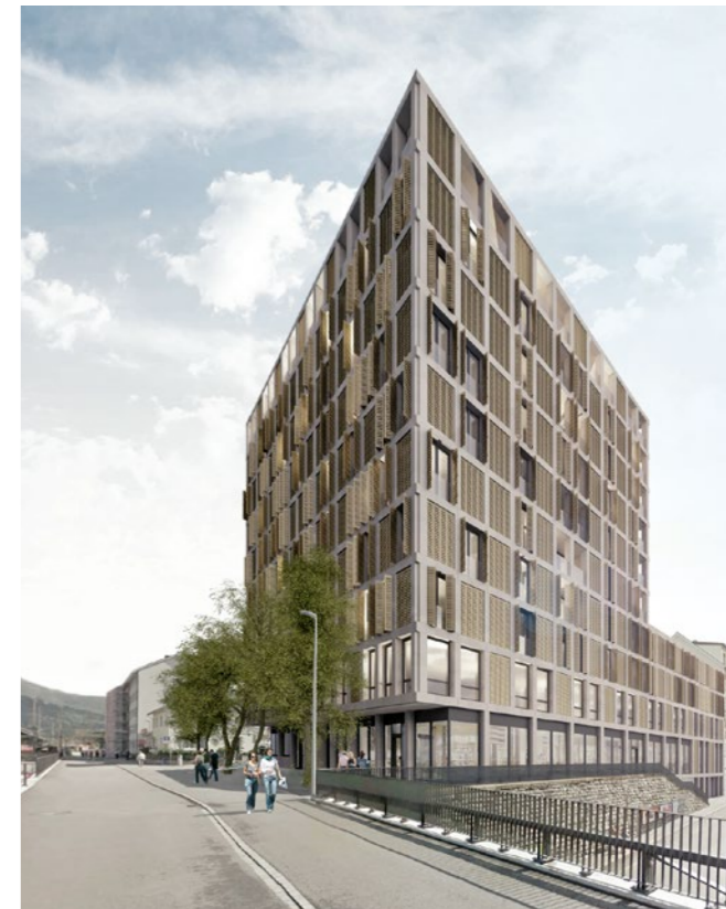
Wohn- und Geschäftshaus «Turuvani» in Olten