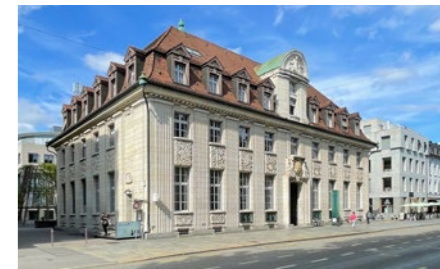
Geschäftshaus in Aarau