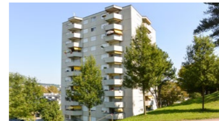
Mehrfamilienhaus in Schlieren