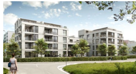
Mehrfamilienhaus «Dreiklang» in Wettingen