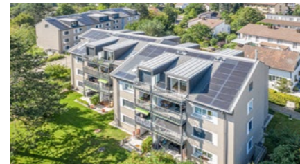
Zwei Mehrfamilienhäuser in Embrach