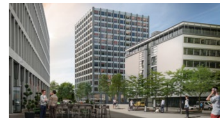
Überbauung «Centurion Tower» in Brugg