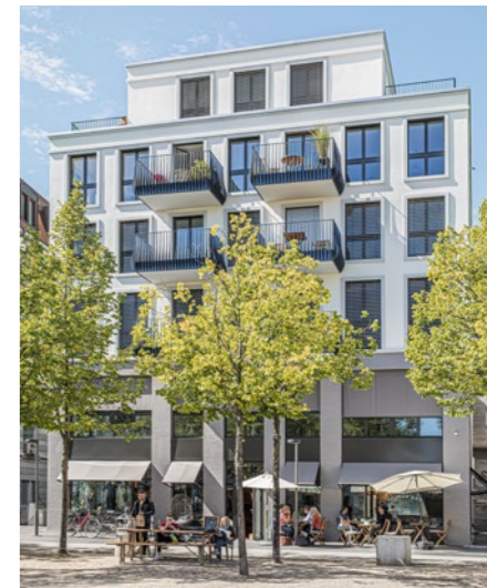
Wohn- und Gewerbehaus «Theaterplatz 3» in Baden