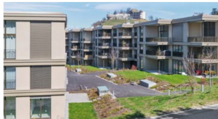
Überbauung «Gartenstadt Widmi» in Lenzburg