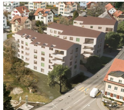
Wohnüberbauung «Visàvis» in Langendorf