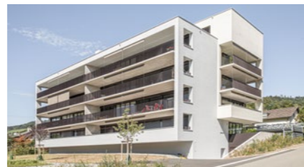
Mehrfamilienhaus «Fliederweg» in Nussbaumen AG