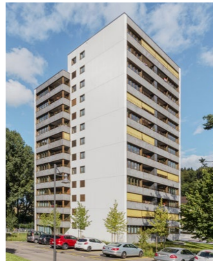
Hochhaus «White Tower» in Baden