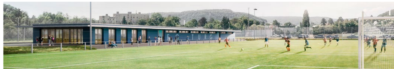
Sportplatz «Oberau» in Turgi