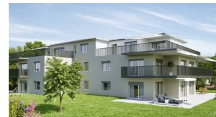
Wohnbauprojekt «Hagenbuech» in Zweislieden-Station