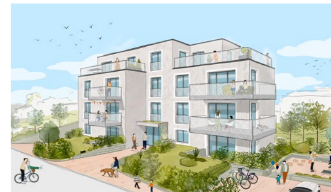
Wohnbauprojekt in Wallisellen