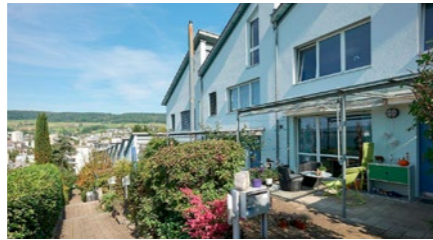
7½-Zimmer-Reiheneinfamilienhaus in Baden