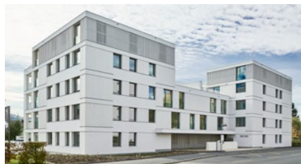
Mehrfamilienhaus «Dreiklang» in Wettingen