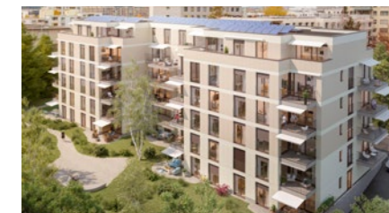
Wohnüberbauung in Zürich Oerlikon