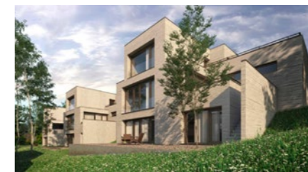
Wohnüberbauung in Buchs