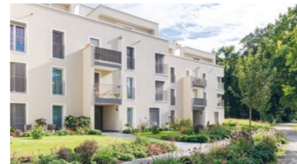
Wohnüberbauung in Baden-Dättwil