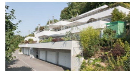
5½-Zimmer-Terrassenwohnung in Würenlos