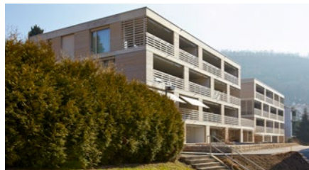
Überbauung «Bad Schwanen» in Ennetbaden