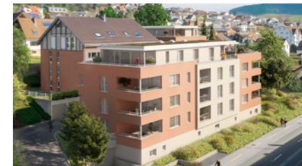
Wohnbauprojekt «Tschuppisbächli» in Ormalingen