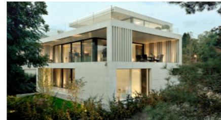
4½-Zimmer-Loft-Villa in Hertenstein