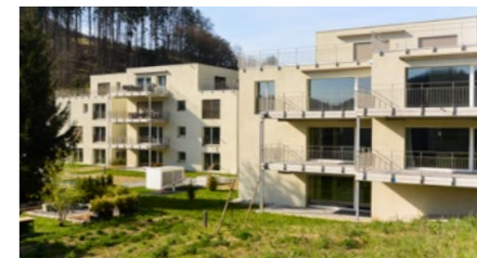
Wohnüberbauung «Apfelhain» in Gränichen