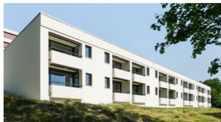
Alterszentrum «Das Kehl», Haus 3, in Baden