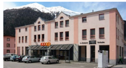
Wohn- und Geschäftshaus in Zernez