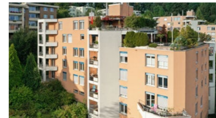
Mehrfamilienhaus in Luzern