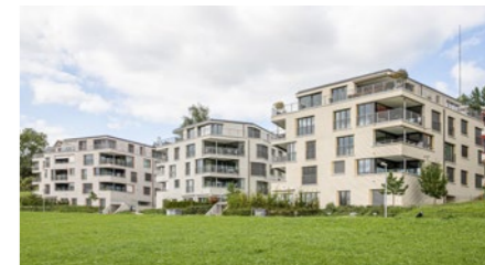
Überbauung «Sternhalde» in Zürich Seebach