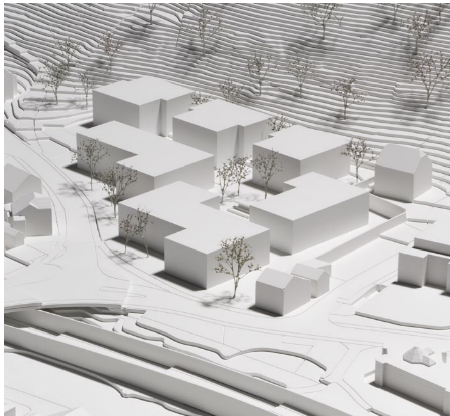
Wohnüberbauung «Erzenberg Immobilien AG» in Liestal