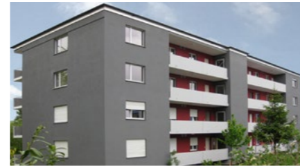
Wohnüberbauung in Rorschacherberg