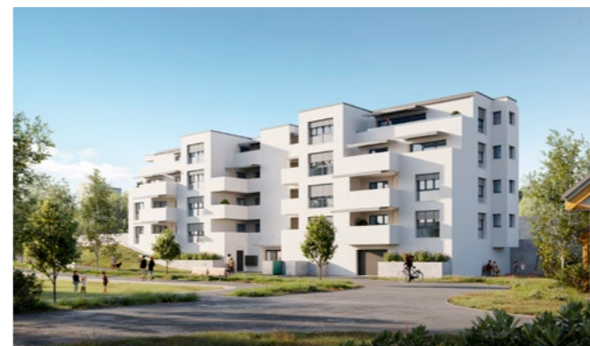
Wohnbauprojekt in Zürich