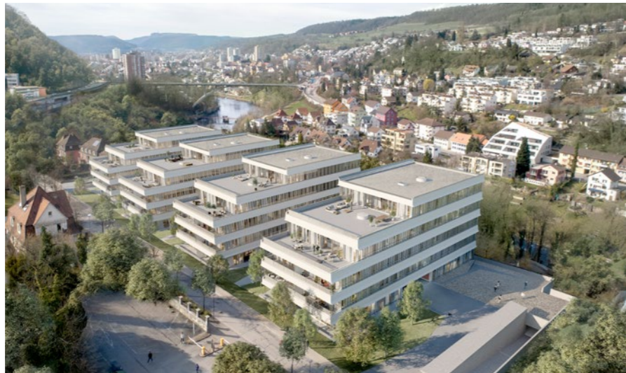
Überbauung «Römerstrasse» in Baden