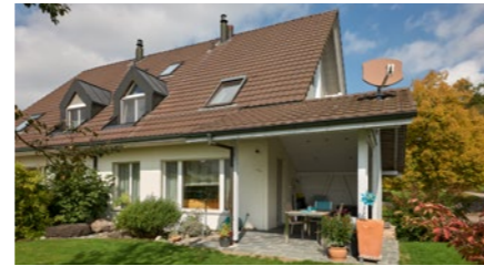
5½-Zimmer-Doppeleinfamilienhaus in Bassersdorf