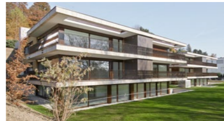
Überbauung «Rebacher» in Oetwil an der Limmat