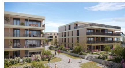
Wohnüberbauung in Diepoldsau