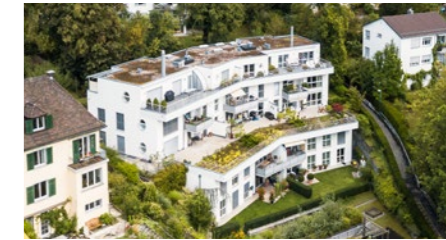
3½-Zimmer-Attikawohnung in Zürich Höngg