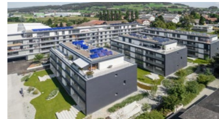
Wohnbauprojekt «Gautschipark» in Reinach BL