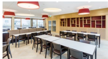
Alters- und Pflegeheim «Länzerthus» in Rapperswil