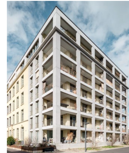
Loftwohnung in Windisch