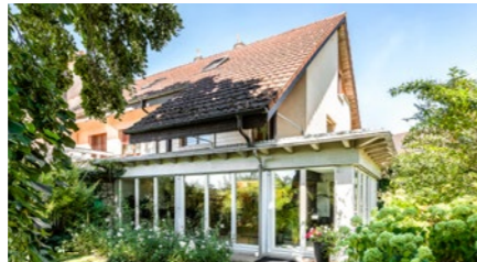
5½-Zimmer-Reiheneinfamilienhaus in Gebenstorf