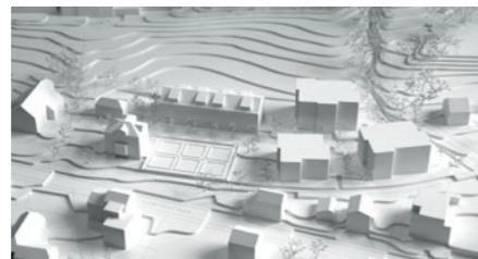
Wohnüberbauung in Hitzkirch