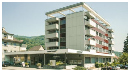
Wohn- und Geschäftshaus in Trimbach