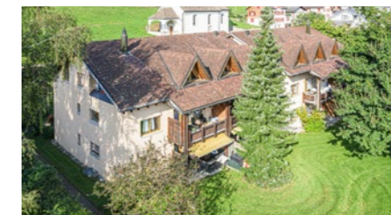
Wohnüberbauung in Uznach