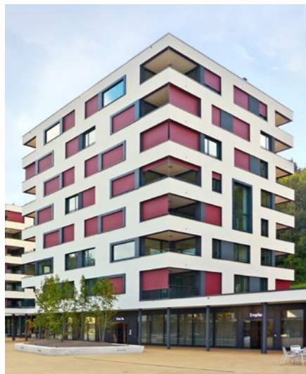
Alterszentrum «Das Kehl» in Baden