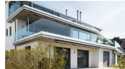
5½-Zimmer-Terrassenwohnung in Nussbaumen AG