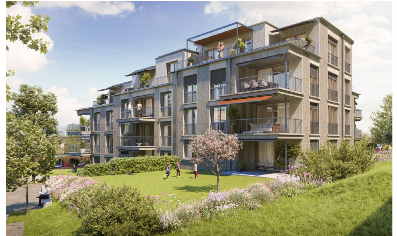
Neubauprojekt: Wohnüberbauung «Holderbachweg» in Zürich.

Markstein bietet sowohl für private als auch für institutionelle Investoren umfassende Portfoliodienstleistungen an – von der Analyse über die Strategieentwicklung bis zum Controlling. Um optimale Renditen zu erzielen, analysieren wir Chancen und Risiken und erarbeiten eine auf den Kunden zugeschnittene Anlagestrategie. Profitieren auch Sie von unserer langjährigen Erfahrung, von unserem persönlichen Netzwerk und von wertvollen Synergien.