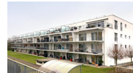
Wohnüberbauung in Olten