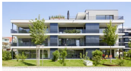
Überbauung «Sonnenpark» in Seon